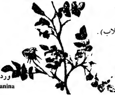
ورد السياج Rosa Canina

أوراقها بيضوية الشكل وتزهو في شهر حزيران، أزهارها مستديرة ومكونة من (٥) ورقات بيضاء مشربة بحمرة خفيفة (وردية) أثمارها فيها بعد حمراء وبشكل الزيتون وحجمه.